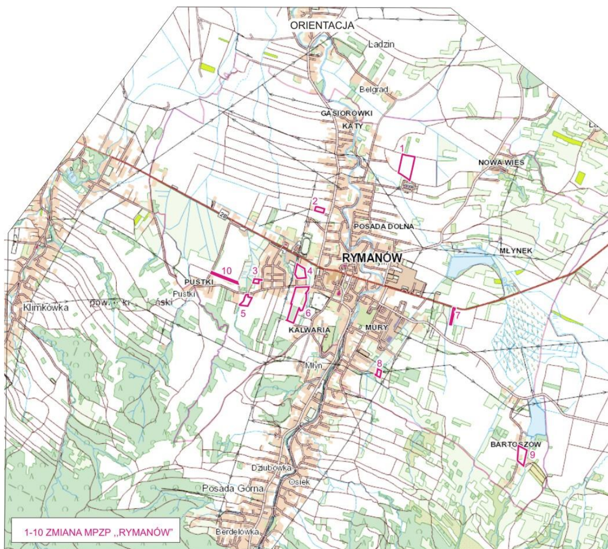
Rysunek 1. Lokalizacja obszarów objętych projektem zmiany planu.

Analizowane obszary położone są w dolinie potoku Morwawa, znajdują się na terenach o mało urozmaiconą rzeźbą terenu.